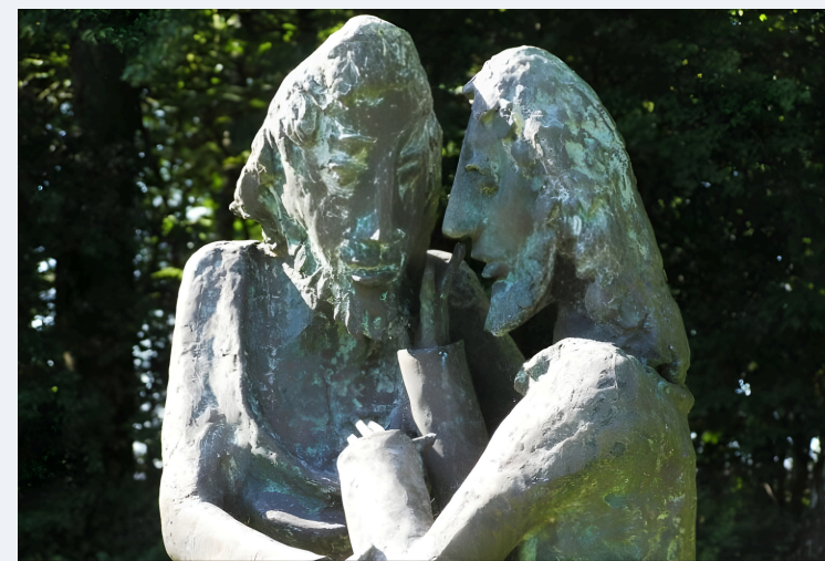
Skulptur “Christus und Thomas” | Die HEGGE Christliches Bildungswerk

Die HEGGE Christliches Bildungswerk Hegge 4 · 34439 Willebadessen · www.die-hegge.de Anmeldung: bildungswerk@die-hegge.de · Tel. 05644 400