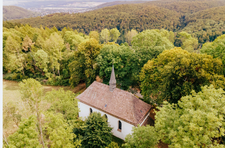
Heiligenbergkapelle | Besim Mazhiqi