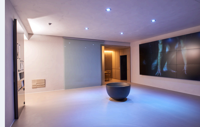
Kirche der Landvolkshochschule und des Jugendhauses Hardehausen

Ev. Kirchengemeinde Altkreis Warburg + Kulturforum Warburg Sternstr. 21 · 34414 Warburg · www.kirche-alkkreiswarburg.de